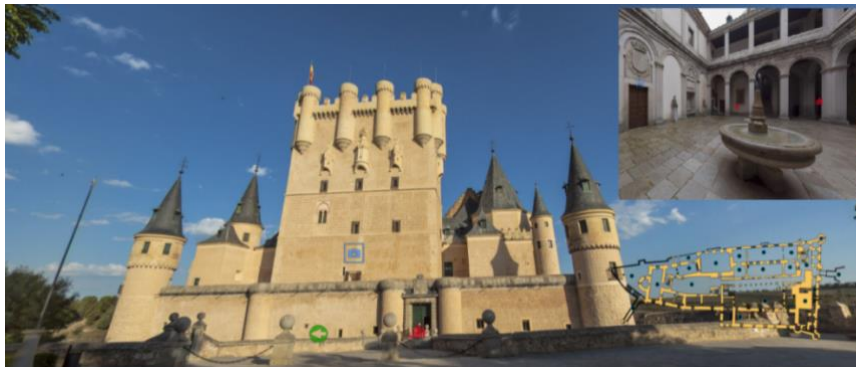
6. ábra: Három dimenziós virtuális túra Alcazar de Segovia váráról