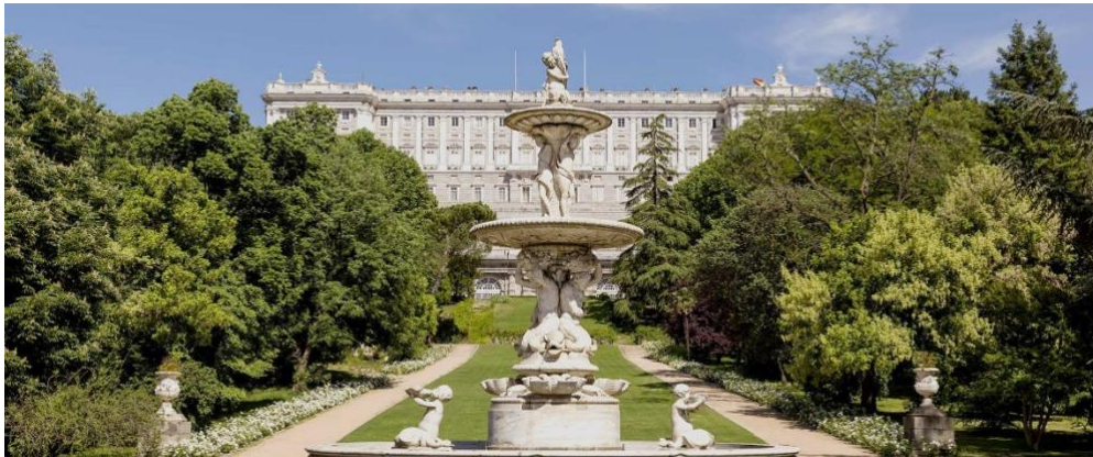
1. ábra: Palacio Real de Madrid – a Patrimonio Nacional tagja