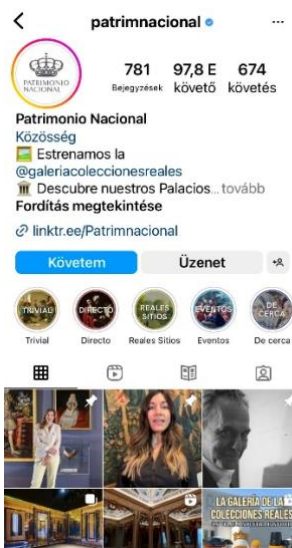
2. ábra: Patrimonio Nacional Instagram oldala