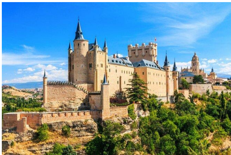
5. ábra: Alcazar de Segovia