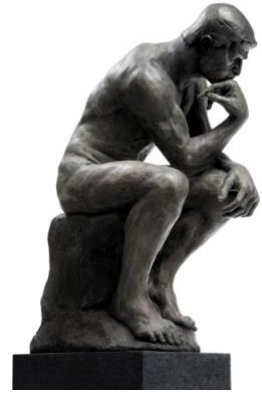
1. kép: François-Auguste-René Rodin: A gondolkodó

„...nincs a világon se jó, se rossz; gondolkozás teszi azzá.” (William Shakespeare: Hamlet, dán királyfi, II. felv. 2. szín)