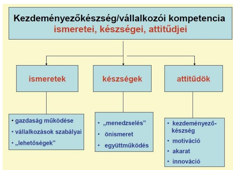
1. kép. ( Zachár, 2009) A kezdeményezőkézség és vállalkozói kompetencia ismeret, készség, és attitűdelemei.

Fontos, hogy tisztában legyünk erősségeinkkel és gyengeségeinkkel is és tudatosan fejlesszük hiányzó vagy gyengébb kompetenciáinkat.